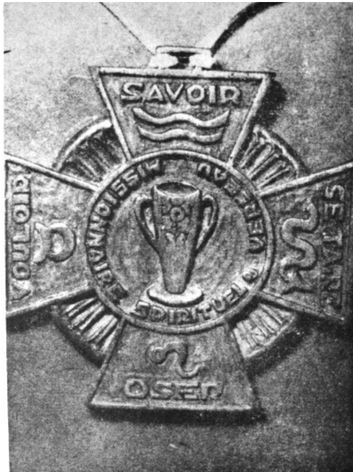
Cruz del Aquarius, pectoral (labrada en madera), usada por el Sublime Maestro durante su Misión Pública Mundial.